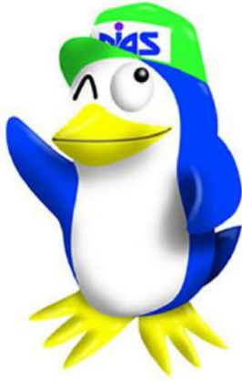
大学イメージキャラクター (愛称：あばまる)